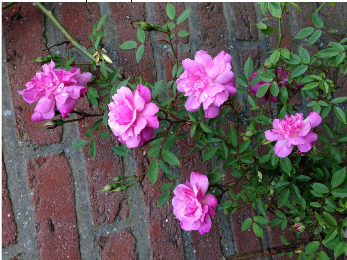
Pompon de Paris, een mini-schatje