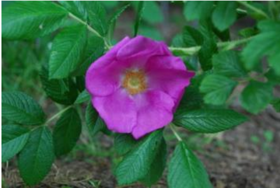
Rosa Rugosa Scabrosa