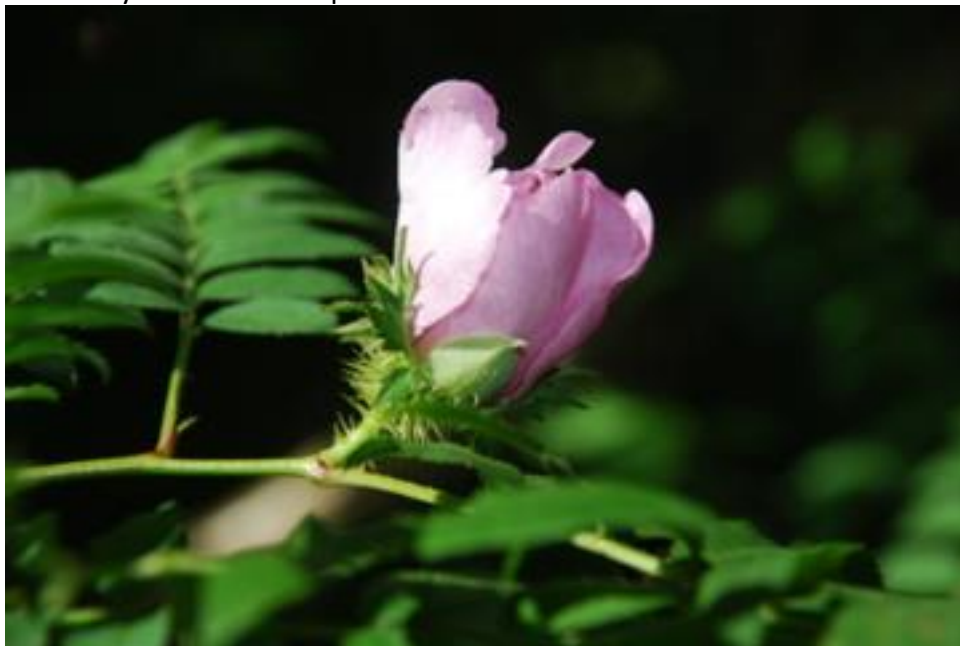
Rosa Roxburghi op 24 05 2015