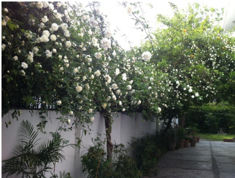
Rosa Banksiae Alba Plena is een lange grote jongen in Islamabad !

Eigenlijk zijn de allereerste bloeiers de Banksiaes. Deze bloeien in vorstvrije streken zo uitbundig dat ze daar als onkruid worden beschouwd. In onze meer gematigde winterluwe streken worden ze iedere lente gekoesterd voor hun weelderige en sterk geurende bloemen. Alles is relatief !