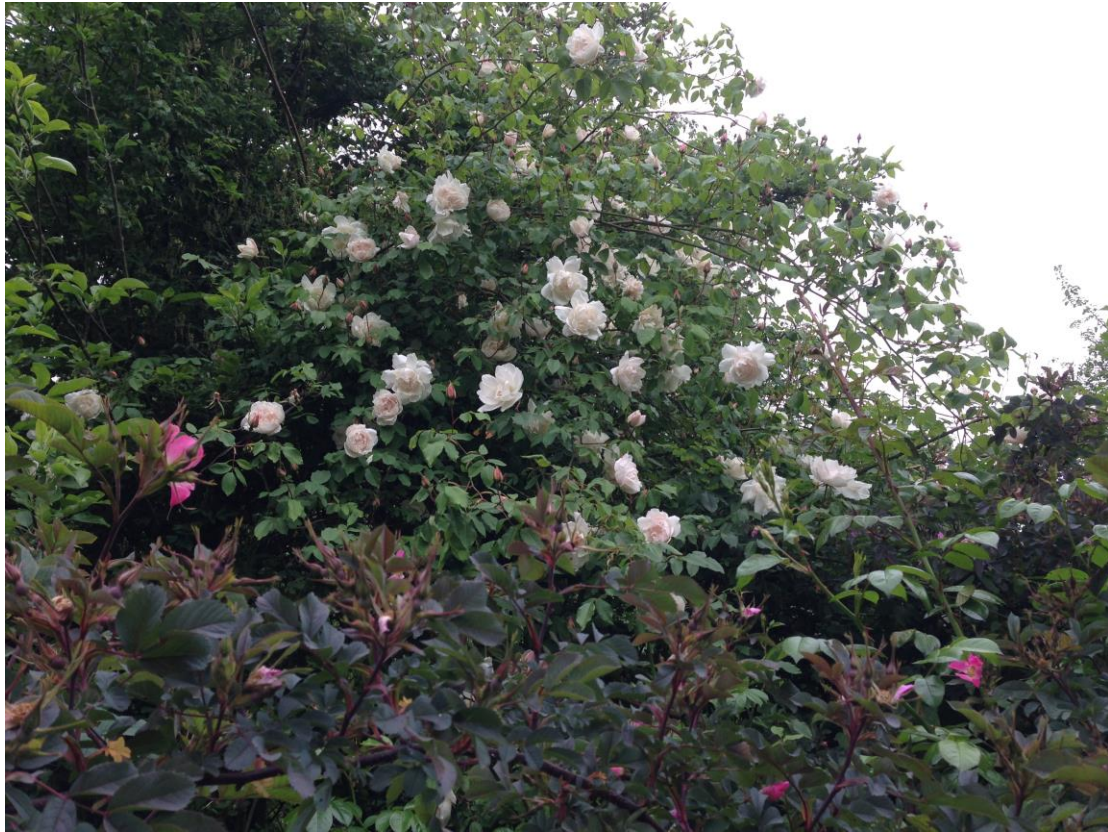
Rosa Glauca (rose) en Madame Alfred Carrière (wit)