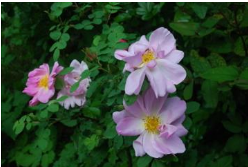
Marguerite Hilling, sport van Nevada, bloeit van laat Mei tot midden Juni