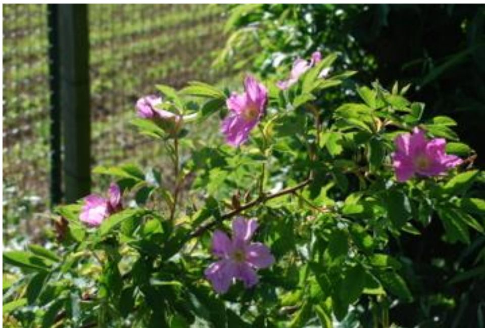
Rosa Californica op 24 05 2015