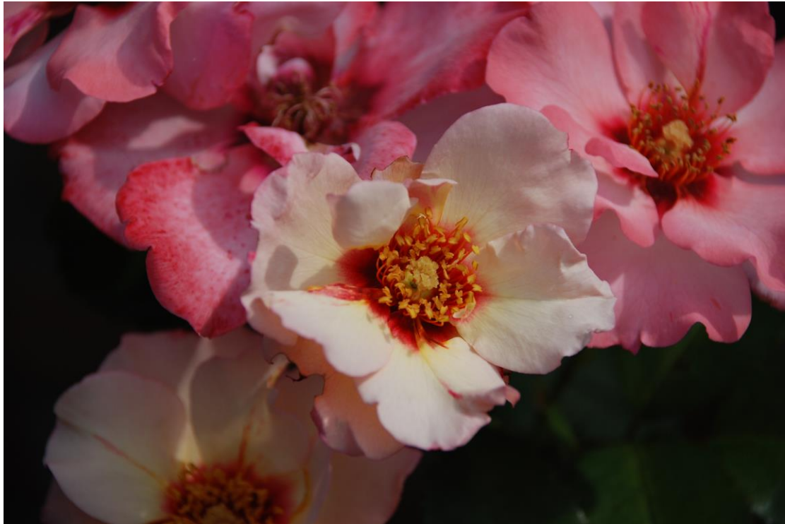
Alisar, Princess of Phoenix (d.d.31/07/2008, maar ik wou jullie de foto niet onthouden)