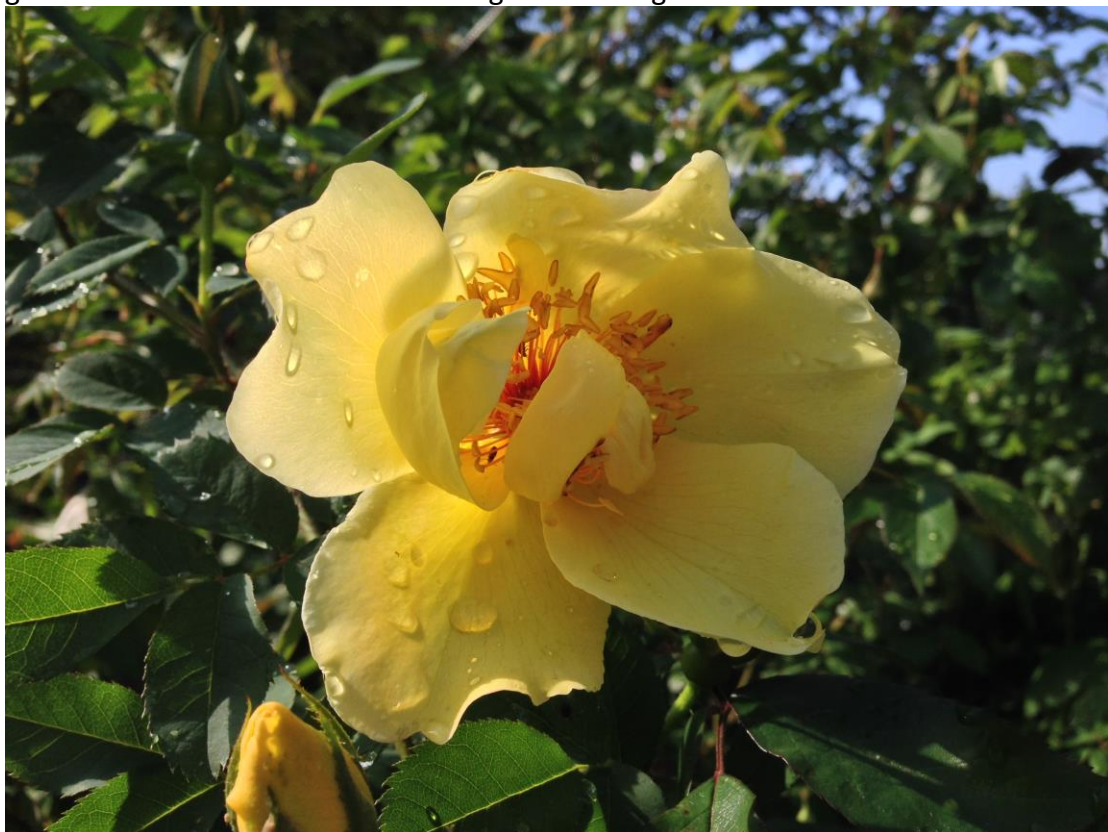
Aïcha, Spinosissimahybride op 15 mei 2015