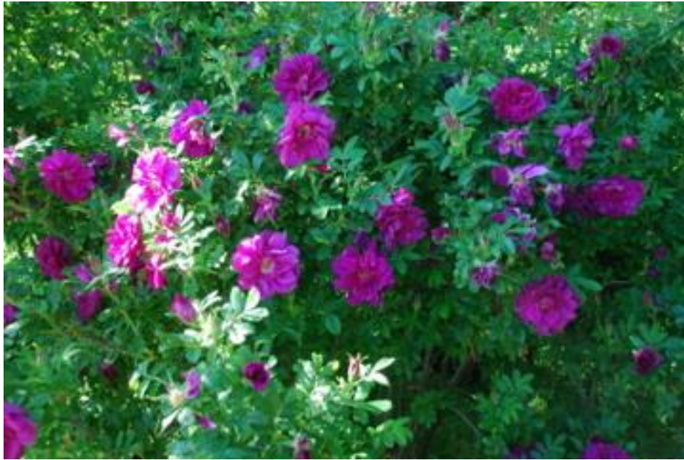
Rosa Rugos Hansa op 24 05 2015