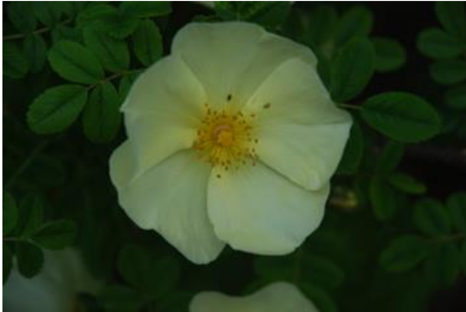
R. pteragonis cantabrigiensis blijft kleiner dan R. hugonis maar de bloemen zijn groter en wat bleker en wat meer "regenbestendig"