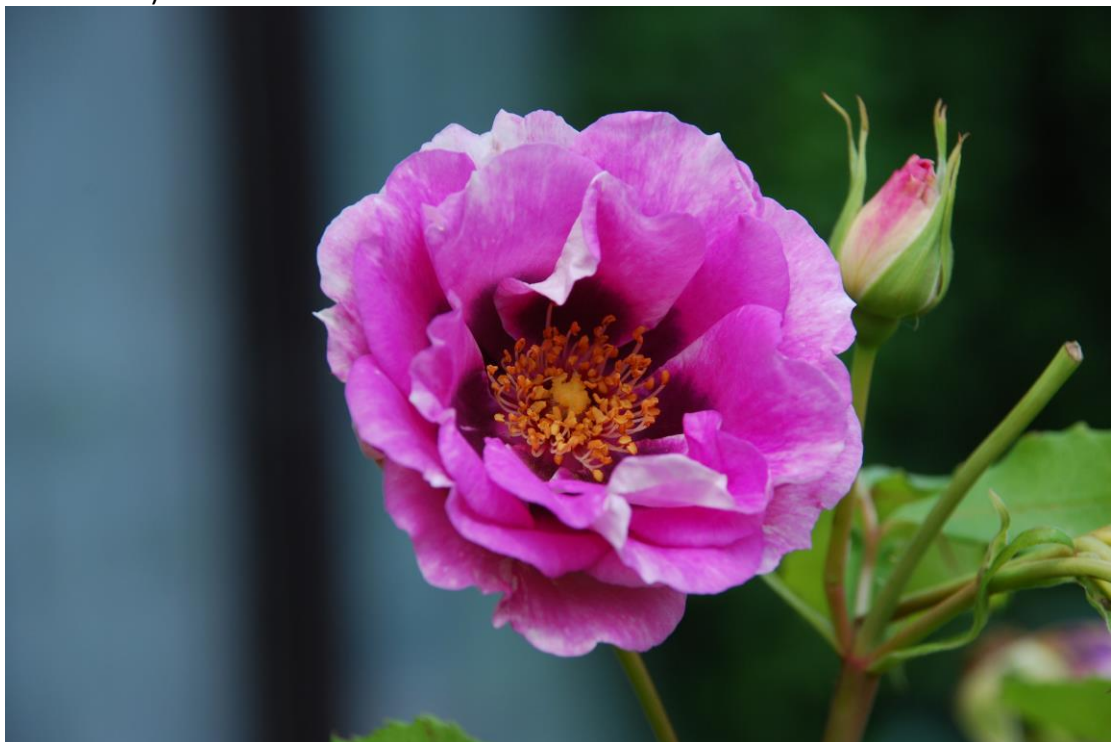
Blue Eyesfor You (d.d.19/06/2012, idem)