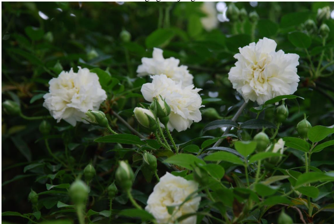
Close-up van Rosa Banksiae Alba Plena