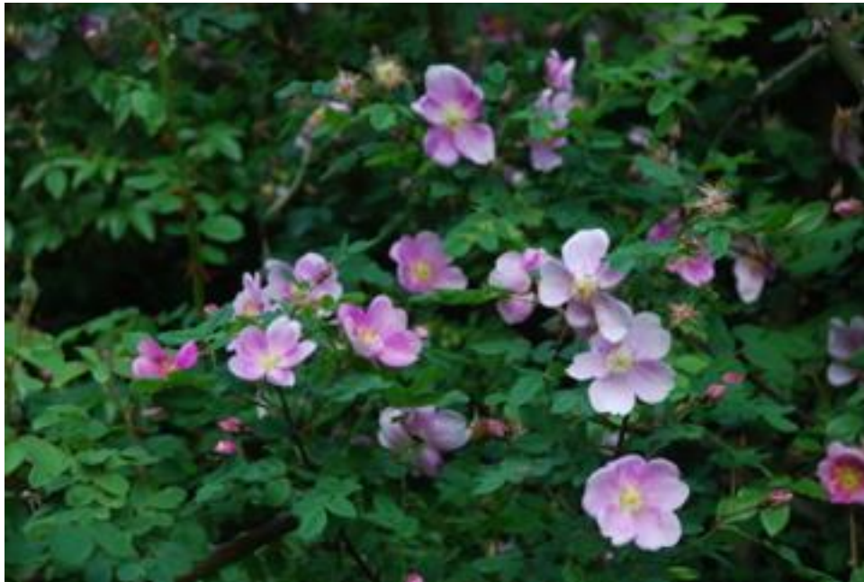
Mary Queen of Scotss