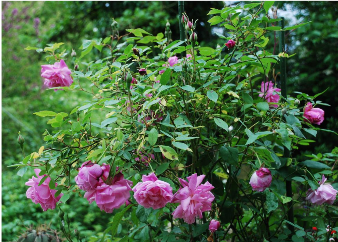
Old Blush China volop in bloei op 8 mei 2015