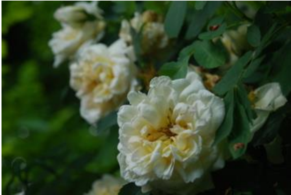
Allister Stella Gray, op 23 mei en nog steeds in bloei op 28 juni