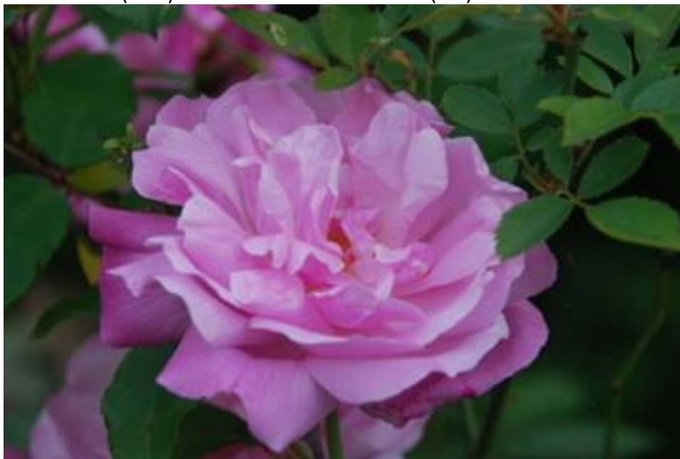
Een andere close-up van Old Blush China