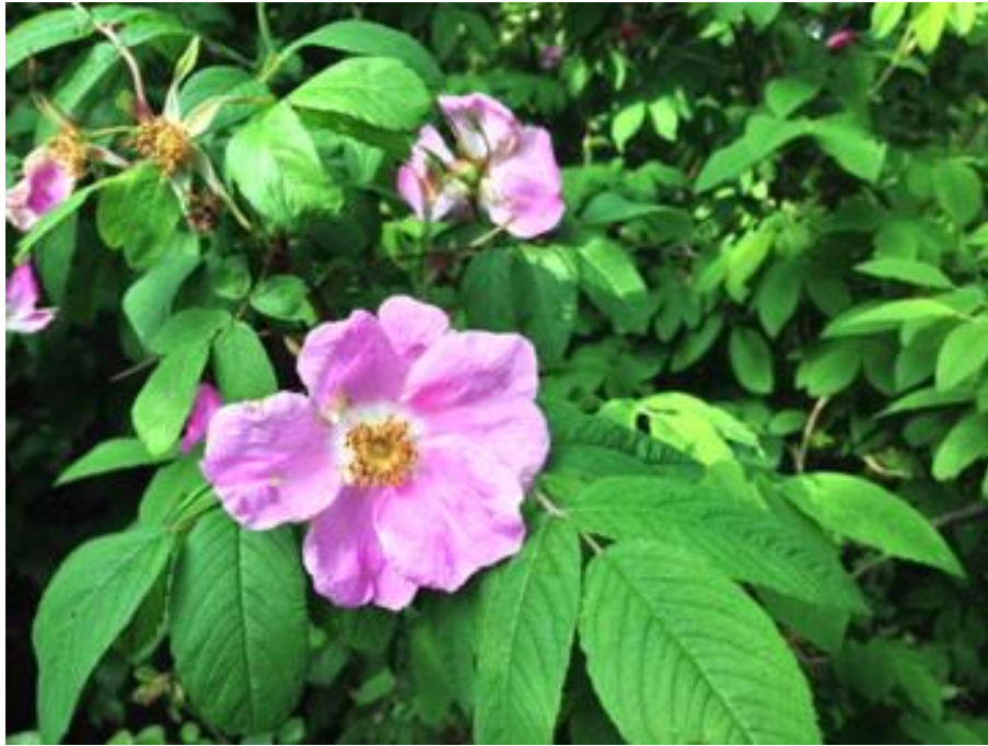
Rosa glabrifolia (C.A.Meyer)

Verder wil ik het ook nog even hebben over een paar andere pareltjes van roosjes die ik in pot op mijn terras heb staan. Zij worden door mij extra vertroeteld omdat het zo een schatjes zijn!