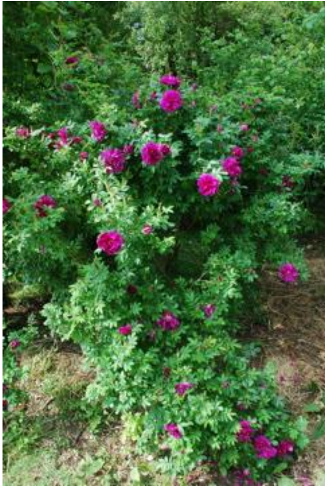
Rosa Rugosa Hansa, door- en vroegbloeiend en o zo geurend !