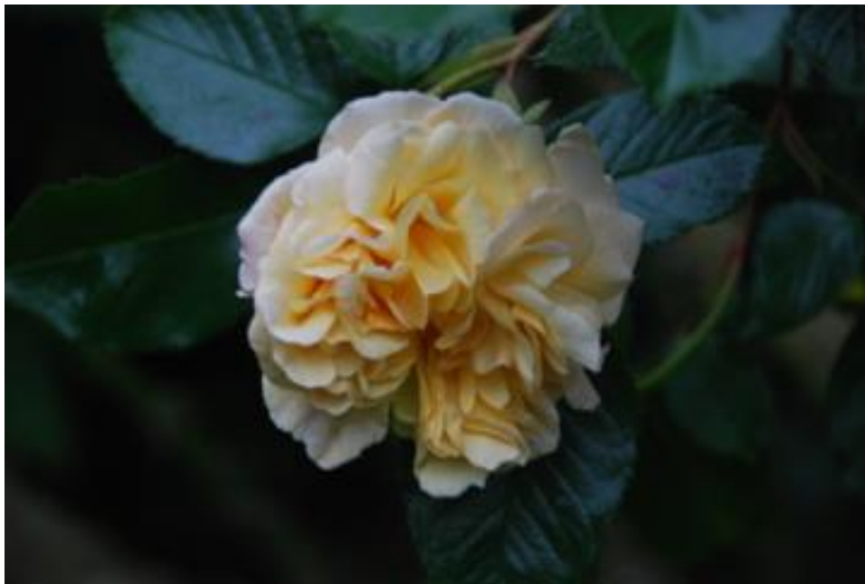
Easley's Golden Rambler, op 23 mei is nog steeds in bloei op 28 juni !