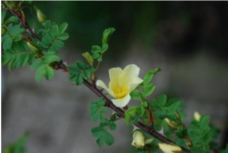
R.primula,'Incense Rose' (Pimpinellifoliae)