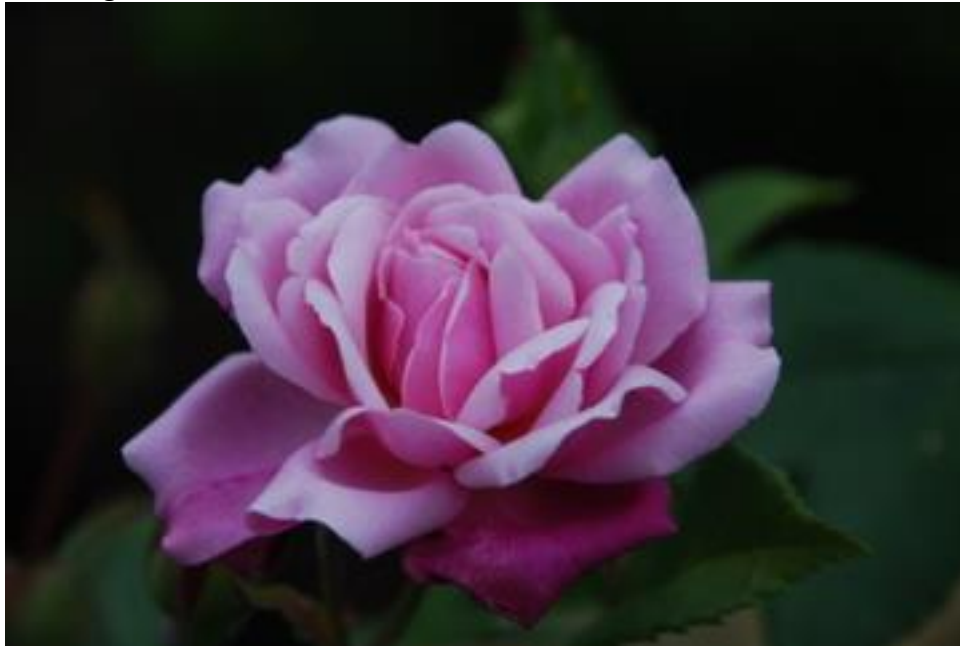
Old Blush China