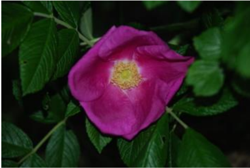
Rosa rugosa Scabrosa