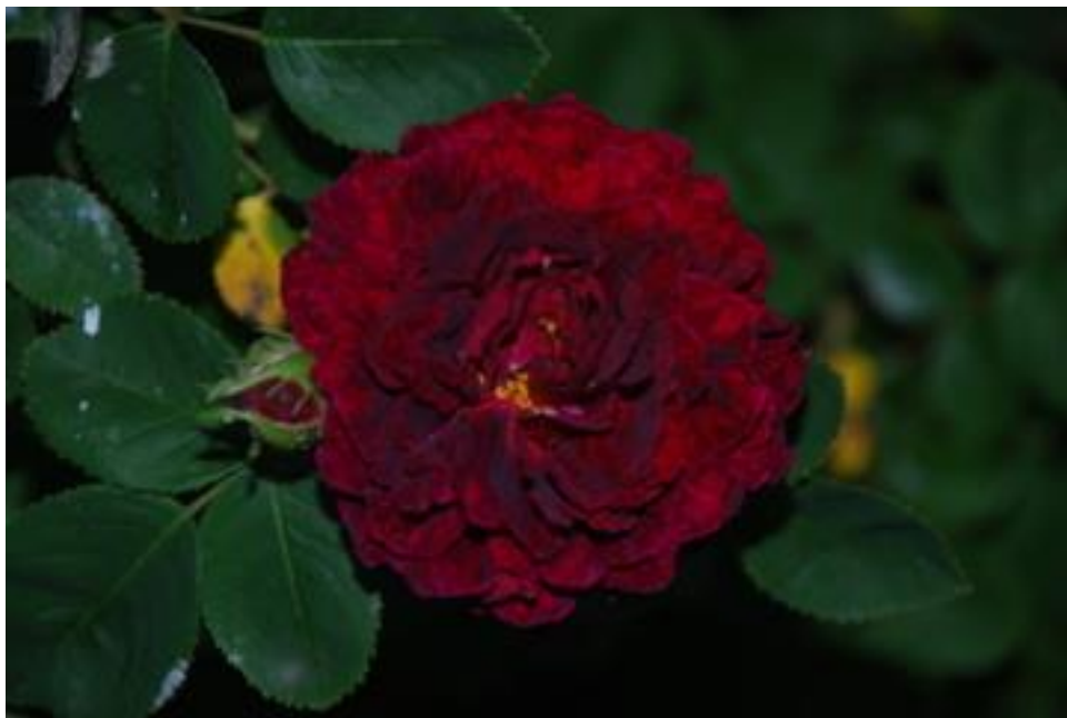
Zigeunerknabe = Gipsy Boy