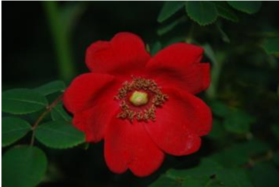
Rosa Moyesi Geranium op 24 mei 2015