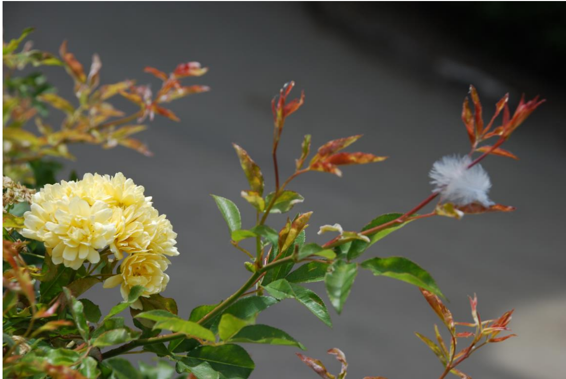
Rosa Banksiae Lutea gefotografeerd even ten zuiden van Rome

Canary Bird en Hugonis worden in onze tuin snel gevolgd door Double White, Williams' Double Yellow, Dunwich Rose, Frühlingsduft en Frühlingsgold, Glory of Edzell, Mary Queen of Scotts, Single Cherry, Stanwell Perpetual en Paula Vapelle, William III en R.primula, allen onder de noemer van "Scotch Roses".